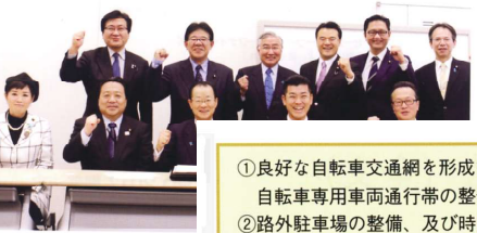
自転車活用推進法案成立の報告会に出席した自民

自転車走行道路、シェアサイクル施設の整備、自転車の安全対策、自転車と公共交通機関の連携など15項目の基本方針を明記