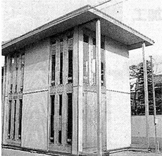
角材のパネルを組み立てた「ボアズ工法」の住宅—名古屋市内で