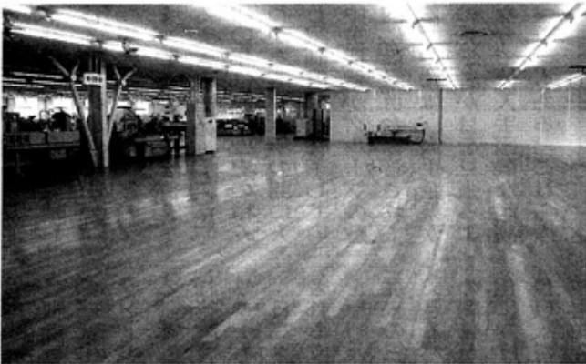
▲ユーザーサポートを主眼に開設される日高機械富来工場

でのテーブルを加工製造できるが、長手方向三〇〇〇mmまでの原板であれば二枚同時加工も自動的に行なえ、省力・生産性の高い木エマシンである。一枚の原板を二つのコラムヘッドで同時加工も行える仕様もあり、加工時に刃物